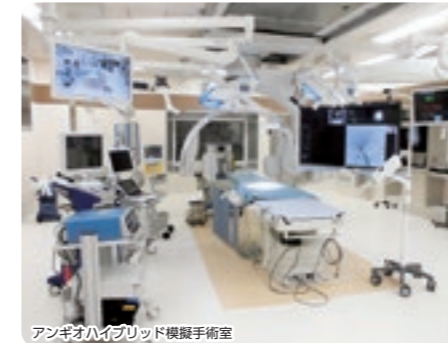
アンギオハイブリッド模擬手術室