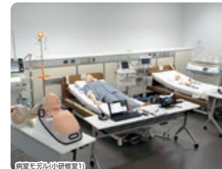
病室モデル(小研修室1)