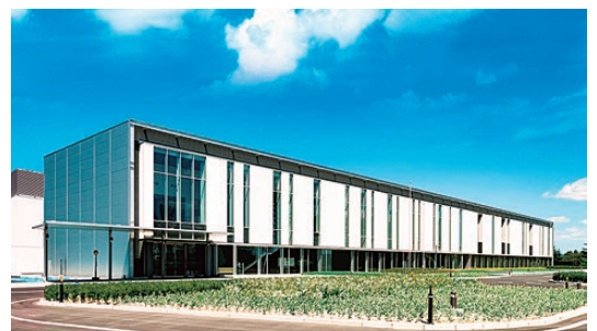
ふくしま医療機器開発支援センター

〒963-8041 福島県郡山市富田町字満水田27番8 TEL:024-954-4014 FAX:024-954-4033 MAIL:jigyobu@fmdipa.or.jp HP:https://fmdipa.jp/